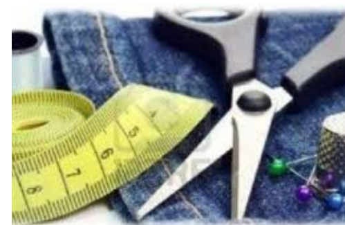
Arrengaments de roba